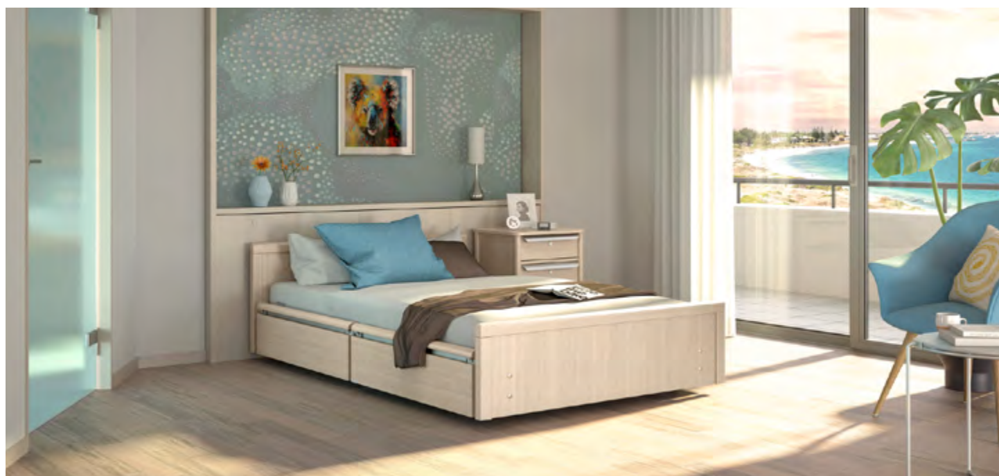
Lit présenté avec un jeu de panneaux G, des demi-barrières SafeFreeFlex 0 et des demi longs pans